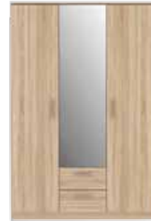
SZAFKA UBRANIOWA NIKS82-D30F