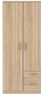
SZAFKA UBRANIOWA NIKS81-D30F