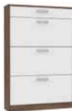
SZAFKA NA BUTY NIKD321-C119